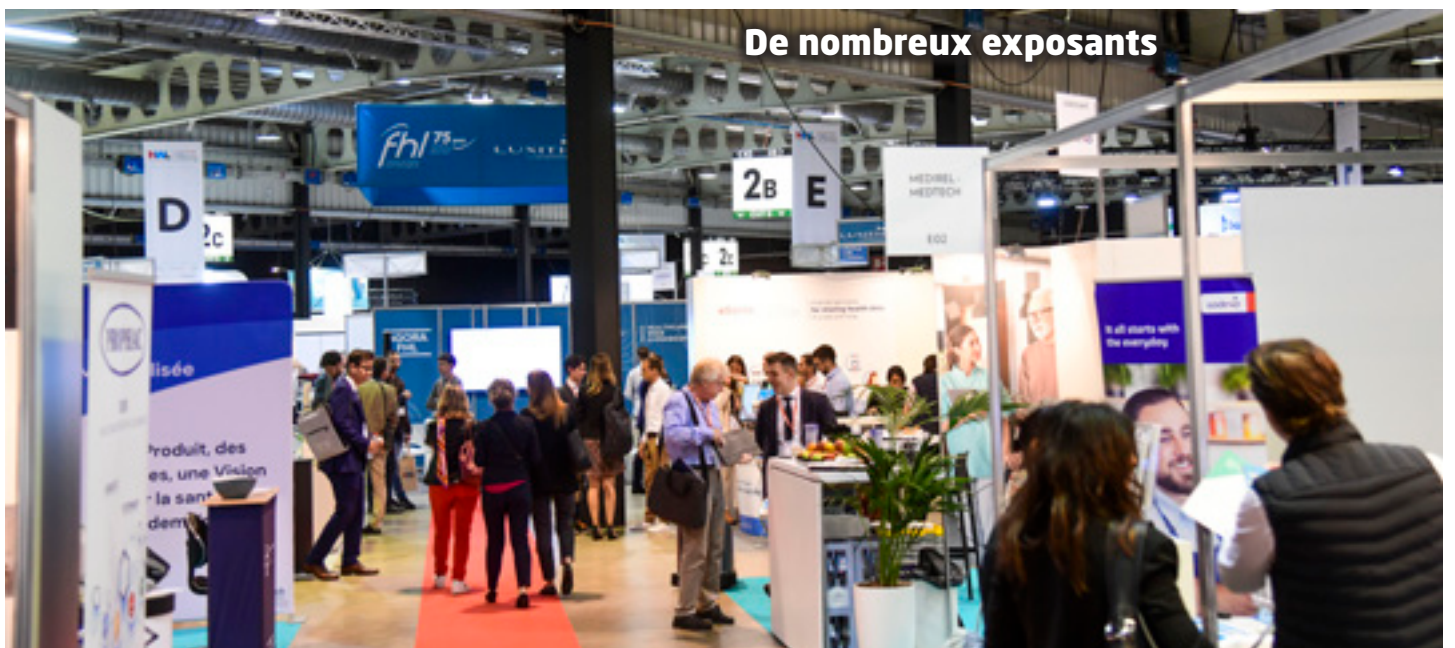
De nombreux exposants