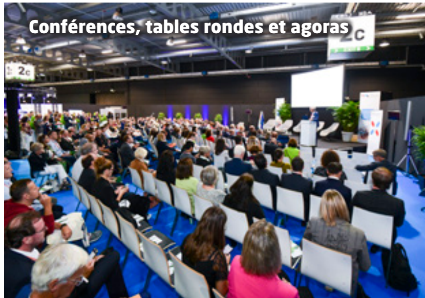
Conférences, tables rondes et agoras