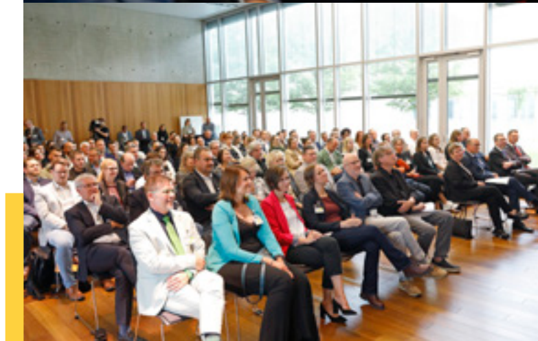
Salle comble pour la célébration des 10 ans d'existence du département